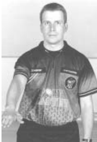
Betræden af målfeltet