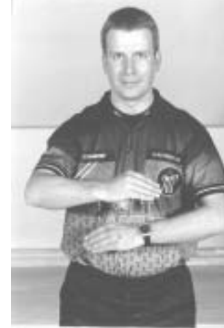
Skridt- eller tidfejl