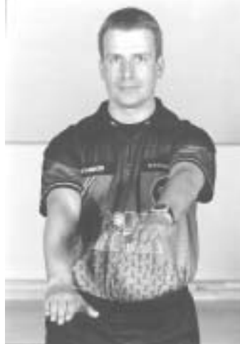
Studse- eller dribblefejl