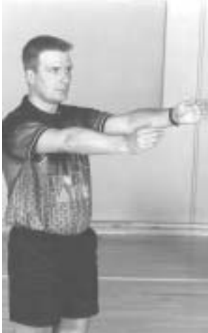
Indkast med retningsangivelse