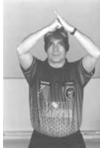
Angrebsfejl – løb eller spring mod modspiller