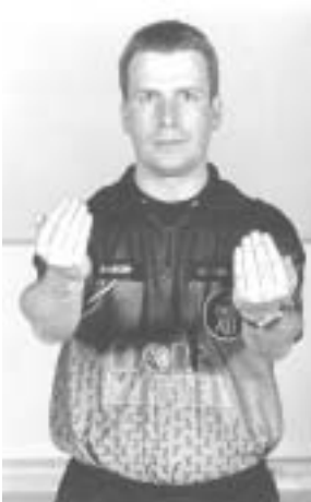
Tilladelse til at betræde banen