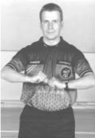
Omklamring, fastholdelse eller skub