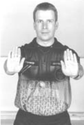
Overhold afstand på 3 m