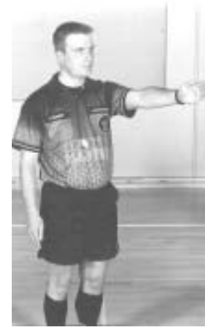
Frikast med retningsangivelse