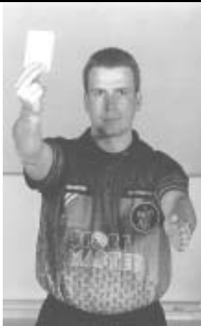
Advarsel / Diskvalifikation